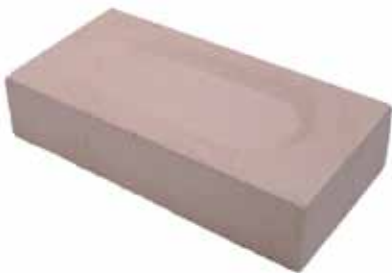
Refractario de 5